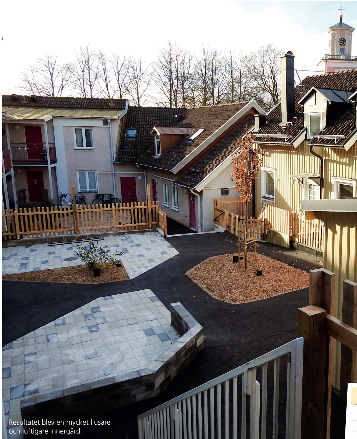
Resultatet blev en mycket ljusare och luftigare innergård.

Du som redan idag har autogiro kommer inte längre att få en utskriven faktura. Om du vill ha din faktura på papper, behöver du höra av dig till oss. Annars måste du aktivt välja någon av de ovanstående alternativen.