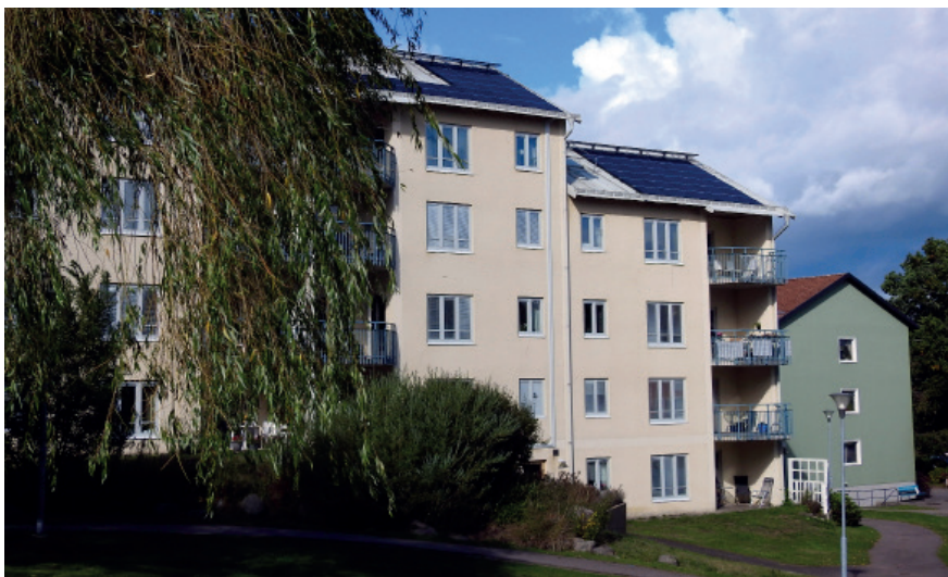
Taket på Storgatan 87 i Blomstermåla har försetts med solceller.