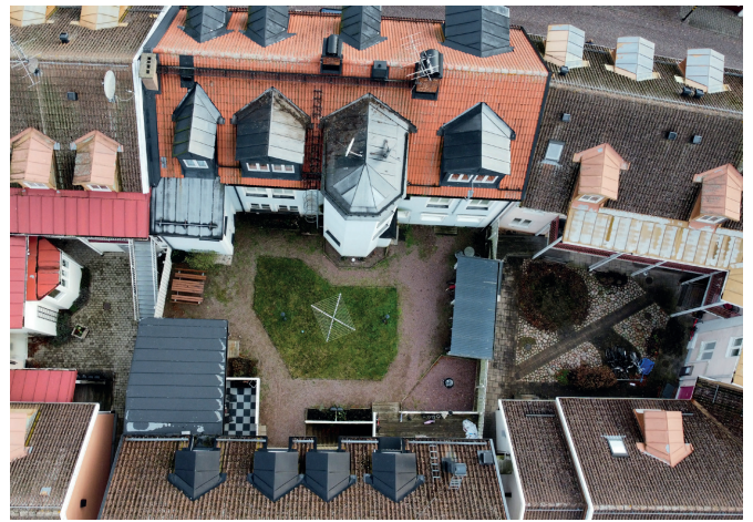
Här ser ni de tre inngårdarna från ovan. De har nu blivit till en gemensam inngård med plats för gemenskap.