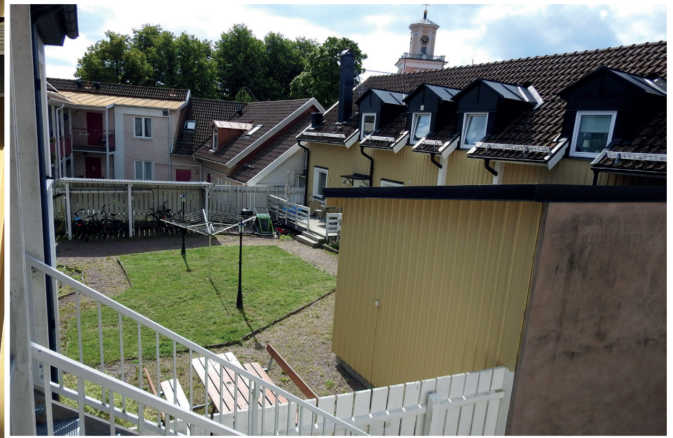
Så här såg det ut i september, strax innan arbetet med den nya gårdsutformningen tog fart.